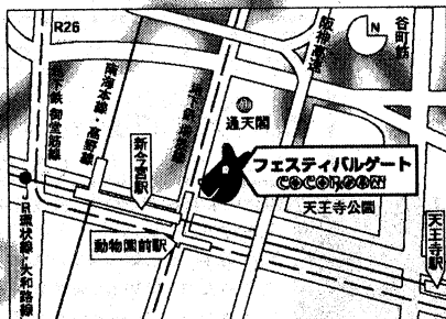
■新世界アーツパーク http://www.sap-s.jp

結局似た者同士で、僕と彼様これからもずっとそんな調子だろうと思うのです。高校生のときに気持ちが戻るとかではなく、ずっとこうして続いて来たのだと思うのです。