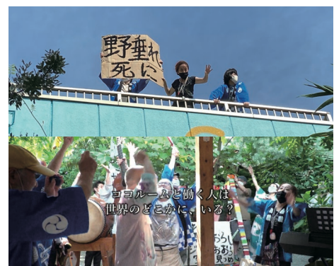
快晴にめぐまれた。法被を着ている。井戸の水汲む音、太鼓、拡声器の音、日々の仕事の音、オ?ペラは商店街からココルームの店内を通して庭へ移動する。

ココルームが待つ人は、「と」と「で」の違いを、身を以て示せる、あるいは内包できる「しぶとくて、しなやかな自分」を持つ人だろう、と。