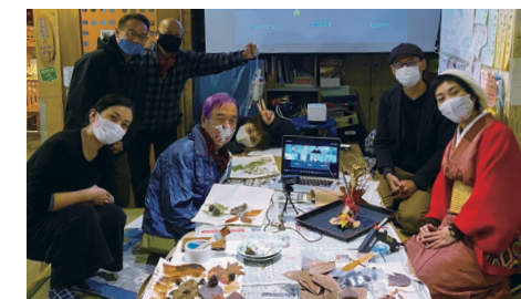
2020カマハン庭に落ちていた葉で作品をつくる。

follow-up to last year's activities around food loss and